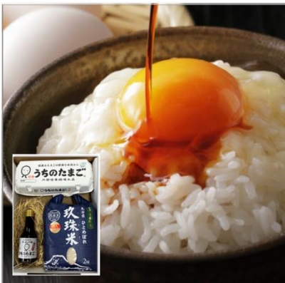
JR九州ファーム うちのたまごTKGセット (玖珠米2kg,たまご10個、だし醤油)

うす黄色の黄身は、天然の地下水とトウモロコシなどの原料をベースにした自然の餌の色が表れている、加工していない本来の自然な色。