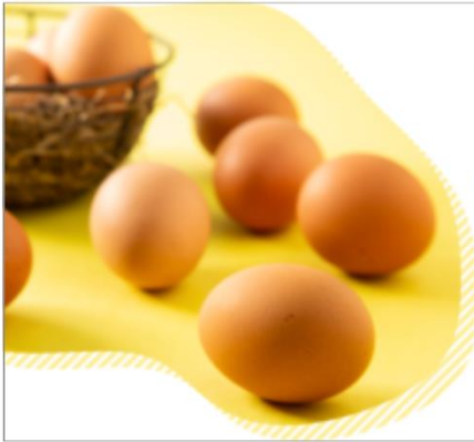
JR九州ファーム うちのたまご30個

宗像市にある“農家レストラン まねき猫”。農薬や化学物質を使わずに育てたレモンをジャムとドレッシングに。