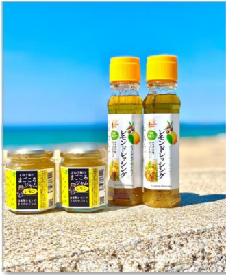
農家レストラン まねき猫 レモンづくしのギフトセット (ドレッシング×2,ジャム×2)